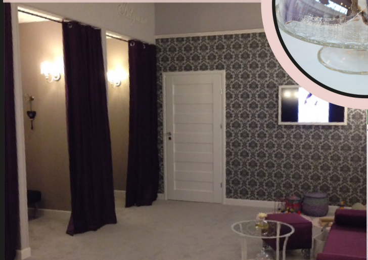
Intymna strefa garderoby