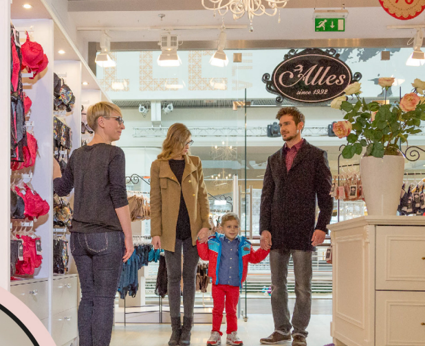
Miejsce przyjazne rodzinie