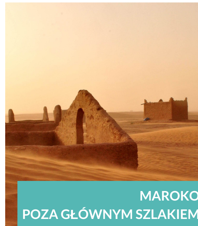
MAROKO POZA GŁÓWNYM SZLAKIEM